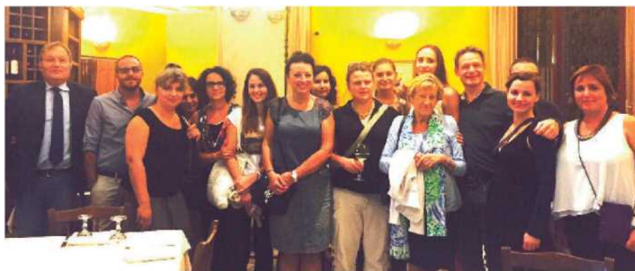
Buyer Mission incoming 20-23 Settembre