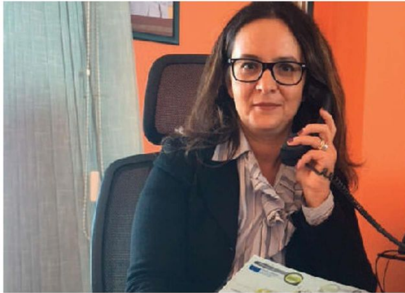
Santa Vaccaro, segretario generale di Unioncamere Sicilia